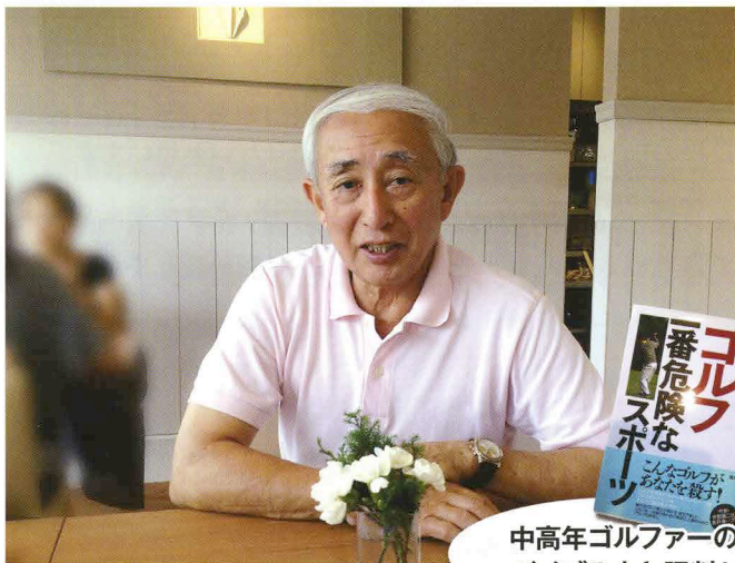
中高年ゴルファーの バイブル本と評判！